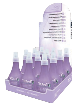
ESPOSITORE "10 in 1" Cod. IN00324 Cm 23 L x 30 P x 17,5 H