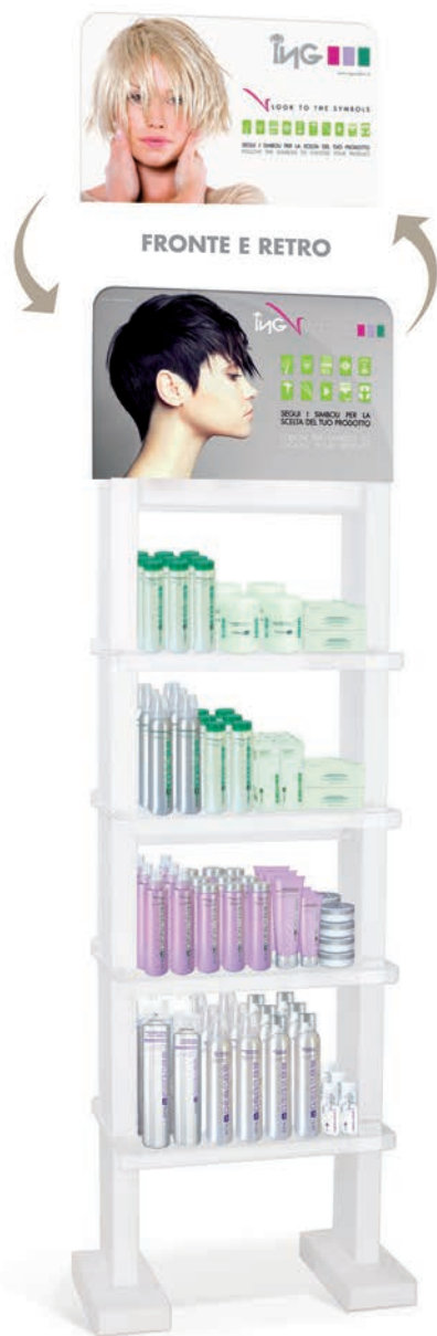
ESPOSITORE GENERALE Cod. IN00259 Dimensioni (crownner compreso): Cm 65 L x 33 P x 201 H