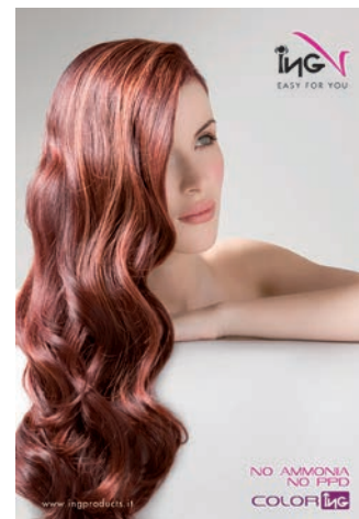
POSTER "NO AMMONIA" Cod. IN00441 Cm 70 L x 100 H