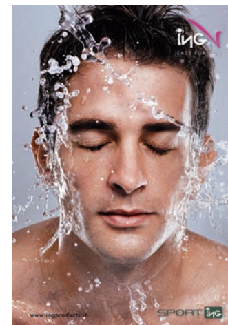
POSTER "SPORTING" Cod. IN00466 Cm 70 L x 100 H