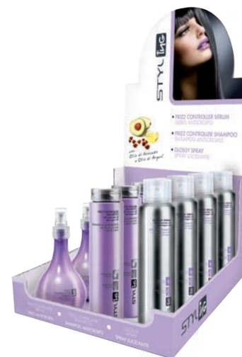
ESPOSITORE "FRIZZ CONTROLLER" Cod. IN00335 Cm 23 L x 26 P x 46,5 H