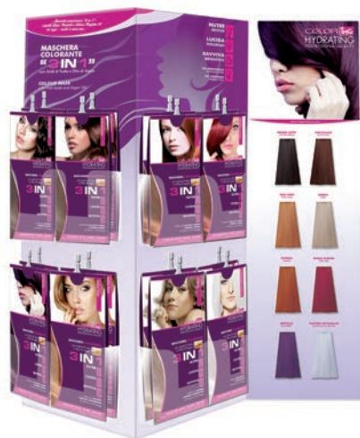
ESPOSITORE "MASCHERA 3 in 1" Cod. IN00298 Cm 44 L x 8 P x 50 H